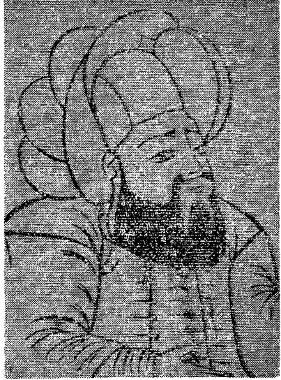
Molla Gürânî (Şakâyıık-ı Nûmâniye'den) (Meşhur Türk Hukukçuları isimli eserden alınmıştır)